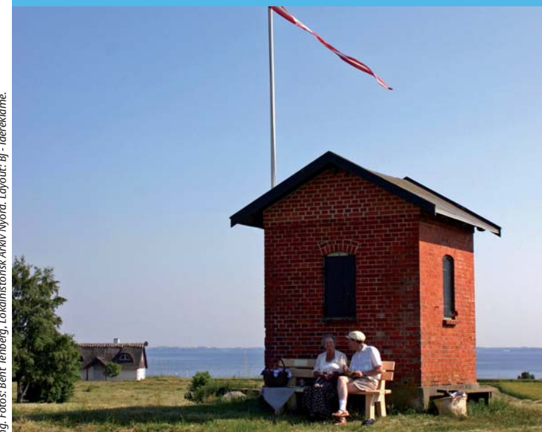
Udgiver: Møn Sydsjælland Turistforening i samarbejde med Nyord Lokalhistorisk Forening. Layout: BJ - Idéklame.